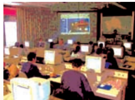
Die Klasse im Computerraum

Unser Computerraum (16 Arbeitsplätze) ist zwar durch den Informatikunterricht dicht belegt, doch es stellte sich heraus, dass im Vormittag immer wieder Lücken entstehen, sodass ich schließlich auf eine ausreichende Zahl an Unterrichtsstunden im Computerraum kam. Vor- und Nachbereitung der Computerstunden fanden in der Regel im Klassenraum statt. Bei der Arbeit im Computerraum saßen die Schülerinnen und Schüler zu zweit oder einzeln an einem Arbeitsplatz. Die Zusammensetzung der Paare sollte sich nach dem jeweiligen Kenntnisstand richten, sodass bezogen auf Fremdsprachen- und Computerkenntnisse voneinander gelernt werden kann.